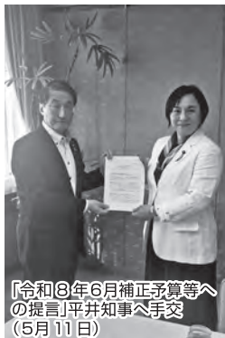
「令和8年6月補正予算等」への提言「平井知事へ手交」(5月11日)

今後も、安心して働き暮らせる鳥取県をめざし、「前向き・元気・行動力」でみなさまと共に取り組んでまいります。