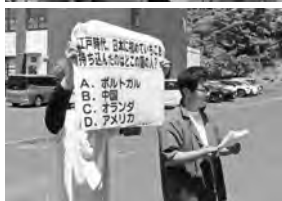
答えはこの機関紙のどこかに記載しています