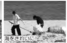
みんなで楽しく、海をきれいに!