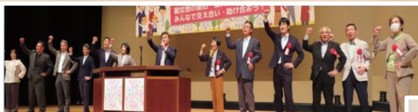
中央メーデー大会 (東部)