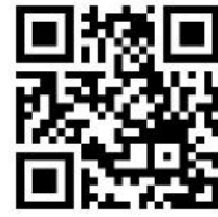
連合鳥取ホームページ