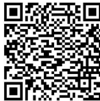
労働相談自動会話プログラム「ゆにボ」