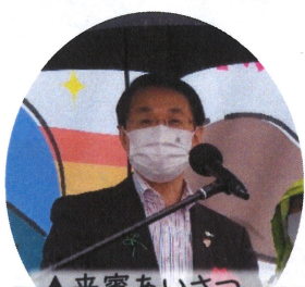
▲来賓あいさつ (平井県知事)