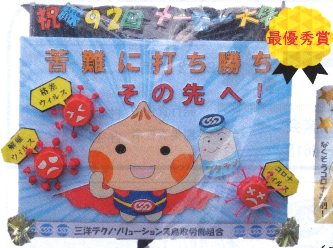
(三洋テクノソリューションズ鳥取労組)