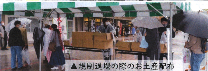
▲規制退場の際のお土産配布