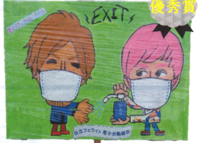
(日立フェライト電子労組)