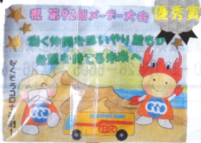
(日本交通鳥取地区労組)