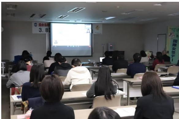
▲オンライン講演の様子

今回の学習会で、女性参画とは「男性に負けない」「男性より優れている」ではなく、『同じ場に同じ様に混ざっている風景である事』だと学びました。