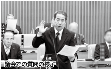
議会での質問の様子

【市長答弁】①本市が支援するケースや、児童相談所と連携して支援するケースもある。保護者のメンタル不調や経済状況がより厳しくなった場合には、直ちに児童相談所に相談し本市も関わり虐待に至ることがないように支援している。