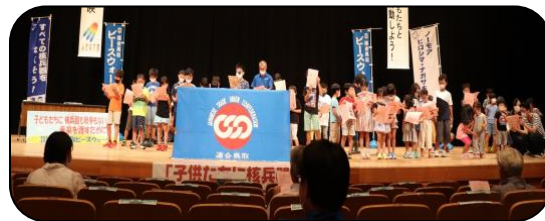
昨年の ピースウォークの様子