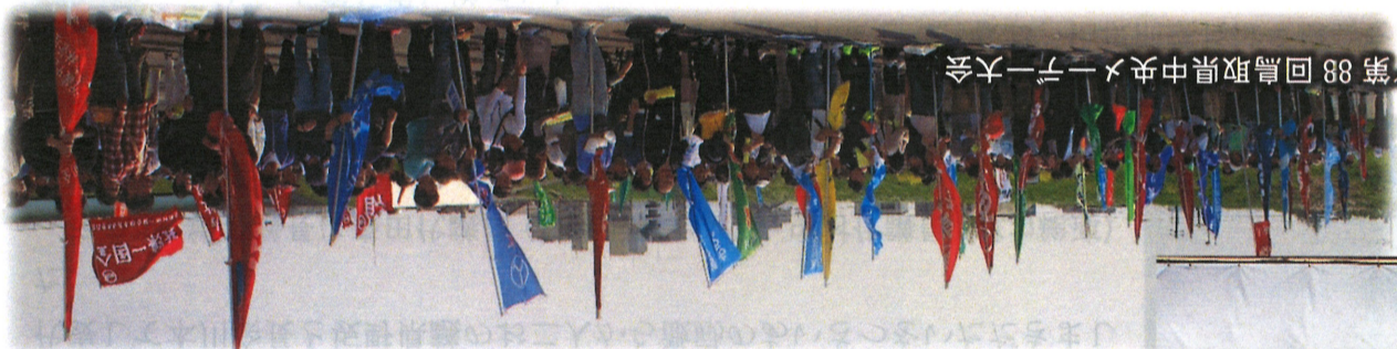
4.29/第88回鳥取県中央メーデー大会