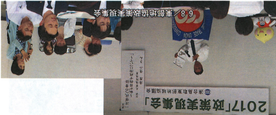
6.8/東部地協政策実現集会