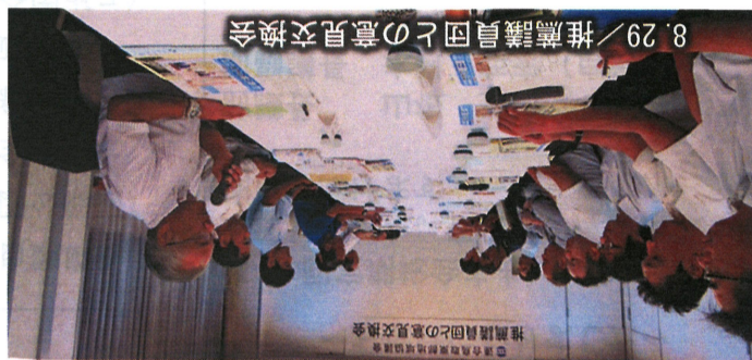
8.29/推薦議員団との意見交換会