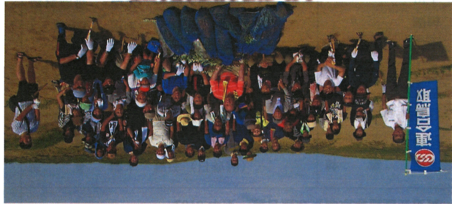
8.20/2017自然環境保全活動