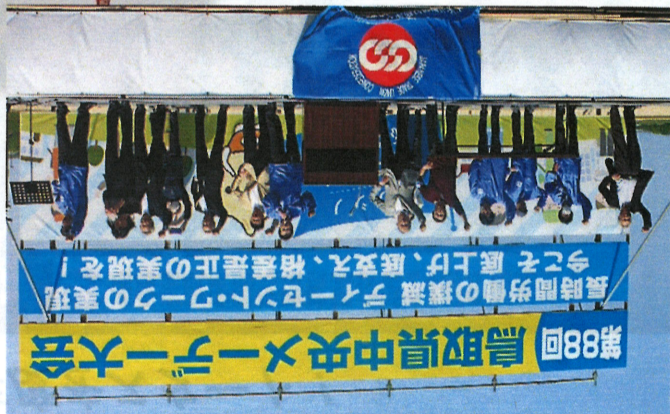
第88回 鳥取県中央メーデー大会 長時間労働の撲滅 タイムセクト・ワークの実現 今こそ底上げ、底支え、格差是正の実現を！