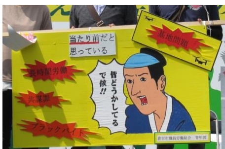
倉吉市職員労働組合