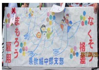
鳥取県教職員組合中部支部