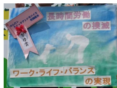
オムロンスイッチアンドデバイス労働組合