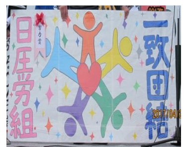
日庄スーパーテクノロジー労働組合