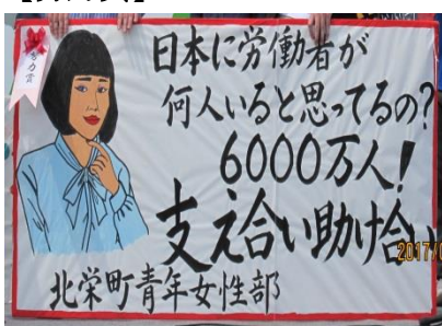
北栄町職員労働組合