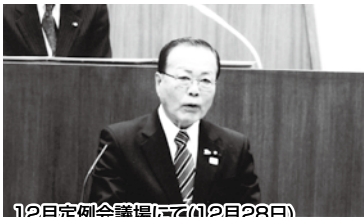
12月定例会議場で(12月28日)