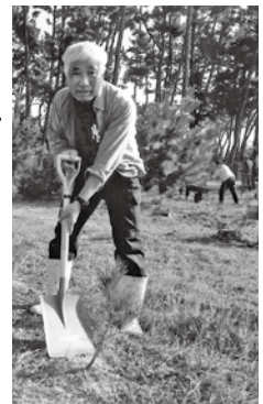
2018年10月の作業に参加